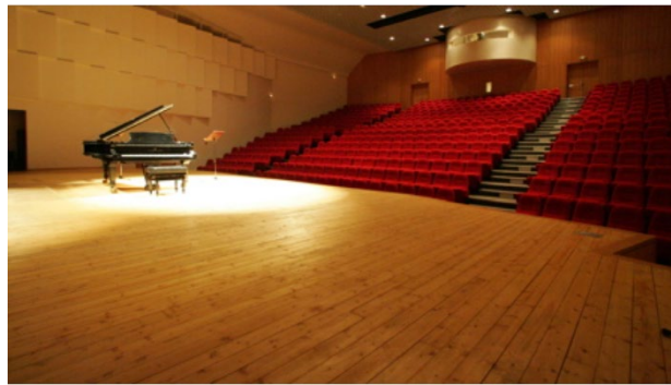
L'incroyable auditorium de Flaine.

Vous aurez également la chance de vous produire lors d'un concert final où vous interprétez les œuvres du répertoire d'orchestre travaillées durant le stage.